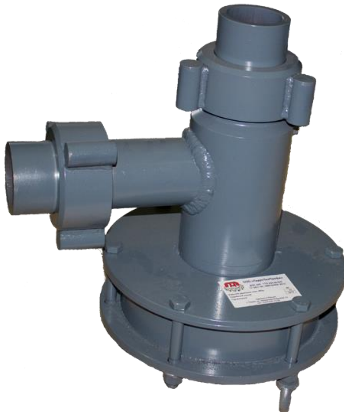
Технические характеристики ДЗУ-400

Управление - дистанционное пневматическое. Верхний отвод предназначен для соединения с манифольдом. К нижнему отводу присоединяется сливная труба. Соединение с манфилдом линзовое или сварное.